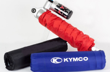
CHAUSSETTE D'AMORTISSEUR NOIR TOUT QUAD & S.S.V AV / AR KA-01-0394 6 €