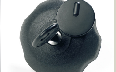
BOUCHON DE RESERVOIR A CLEF MXER / KXR / MXU KA-01-0211 24 €

NOS PARTENAIRES MONDIAL ASSISTANCE AMV VIAXEL