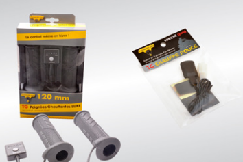
POIGNEES CHAUFFANTE QUAD LUXE 120 mm KA-01-0445 85 €